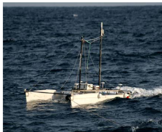
Der geschleppte Katamaran.

Interessant sind Gebiete, mit tiefer Vermischung, für die ein Austausch zwischen dem tiefen Nährstoffpool und dem Oberflächenwasser in der euphoten Zone anzunehmen ist. Da das Stationsnetz bei Beprobung mit dem CTD recht grob ausfällt und so insbesondere Fronten nicht gut erkennbar werden, wurde der Schnitt ein zweites Mal mit einem geschleppten CTD befahren. Das ist Gerät ist wie ein Tragflügel geformt und kann vom Schiff aus über das Schleppkabel durch Klappen wie ein Flugzeug gesteuert werden. Mit unserer Konfiguration unduliert das Gerät zwischen der Meeresoberfläche und einer maximalen Tiefe von etwa 100 m. Auf dem Gerät sind Sensoren für Temperatur, Leitfähigkeit, Druck, Sauerstoffkonzentration und Fluoreszenz montiert, die über das Schleppkabel ihre Messwerte direkt an einen Computer auf dem Schiff senden. Auch ein optischer Planktonzähler ist mit an Bord, der Größenverteilung und Häufigkeit von Planktons bestimmt.